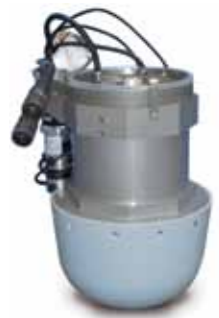
ADT Antenna Pedestal

For high-rate RF data transmission between airplanes and/or UAVs and to ground stations OHB System AG has developed the ARDS Data Link. It is able to transmit data (e.g. high-resolution aerial reconnaissance data) disturbance-free over more than 250 kilometers and hereby enables real-time surveillance and reconnaissance.