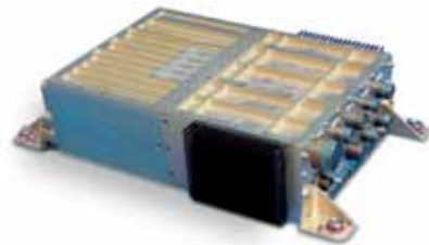
Air Data Terminal