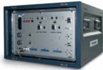
Ground Data Terminal